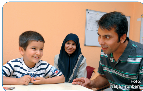
Einsatz Kita Pieschener Kinderinsel

Das Projekt wird vom Bundesministerium des Innern, dem Freistaat Sachsen und der Stadt Dresden gefördert.